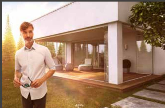
Schiebe-Dreh-Systeme Slide and Turn Systems