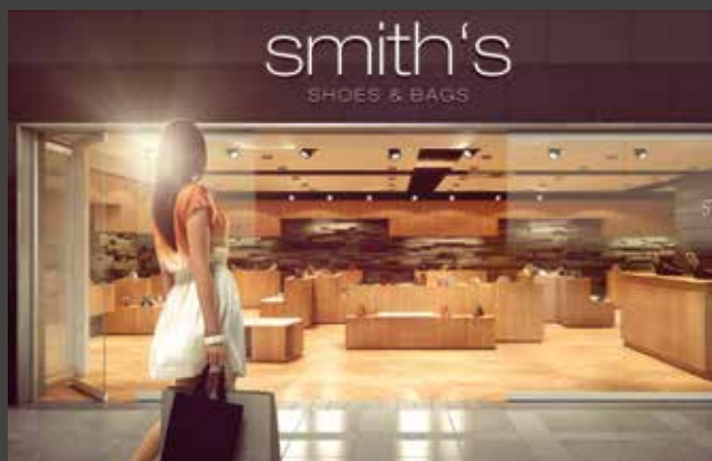
Horizontal-Schiebe-Wand-Systeme Horizontal Sliding Wall Systems

LAHOLMS GLAS AB Kullgårdsvägen 41 312 34 Laholm Telefon: 0430-149 40