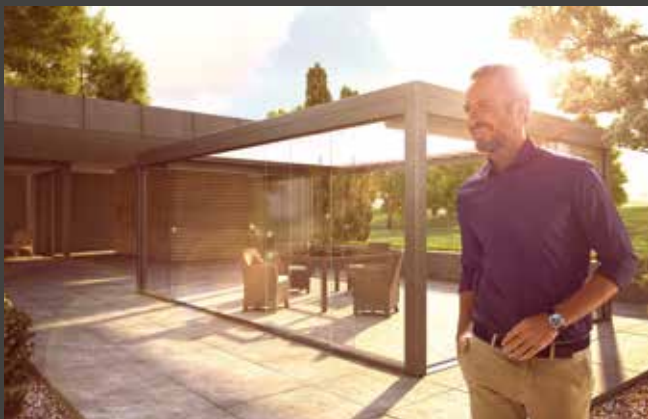
Schiebe-Systeme Sliding Systems